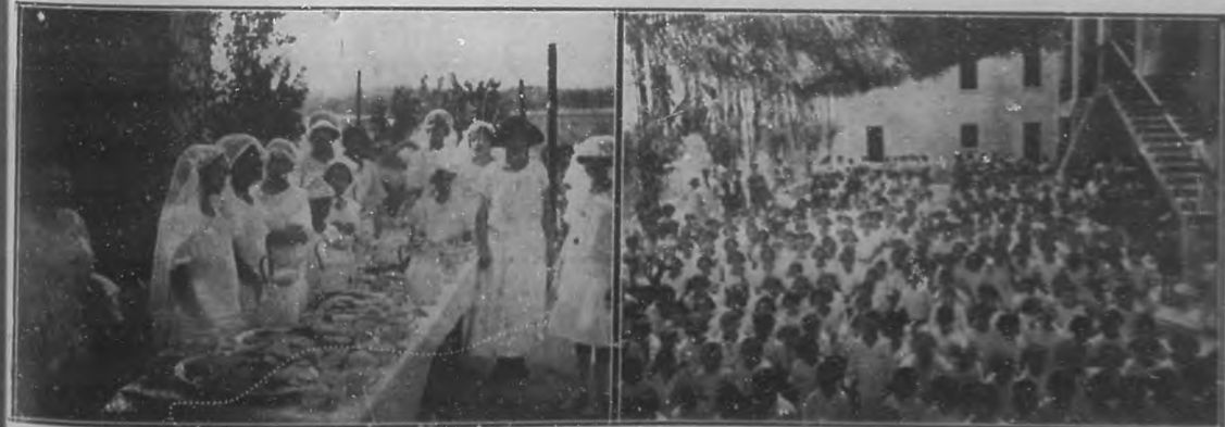
LA INAUGURACION OFICIAL DEL ASILO-CRECHE "RAFAEL DE CARDENAS"—A la izquierda: Un grupo de niñas asiladas tomando el desayuno el día de la inauguración.—A la derecha: Aspecto general de la concurrencia que asistió a la inauguración oficial del Asilo-Creche.