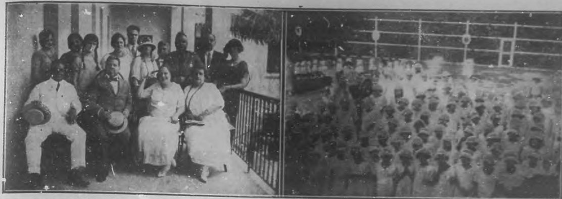
LA INAUGURACION OFICIAL DEL ASILO-CRECHE "RAFAEL DE CARDENAS"—A la izquierda: El gobernador Barreras y demás personalidades que asistieron al acto inaugural.—A la derecha: Un grupo de niñas del Asilo que hicieron ese día la primera comunión.

Ha poco se efectuó la inauguración oficial del Asilo-Creche "Rafael de Cárdenas", situado en el Reparto "Jacomino".