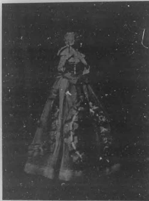
PRIMER PREMIO Lámpara eléctrica de porcelana fina.