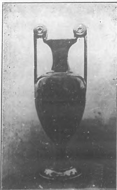
SEGUNDO PREMIO Anfora de porcelana estampada

tercera de nuestro Concurso, publicamos en esta página las fotografías de los tres valiosos objetos de arte que se entregarán como premio a las triunfadoras.