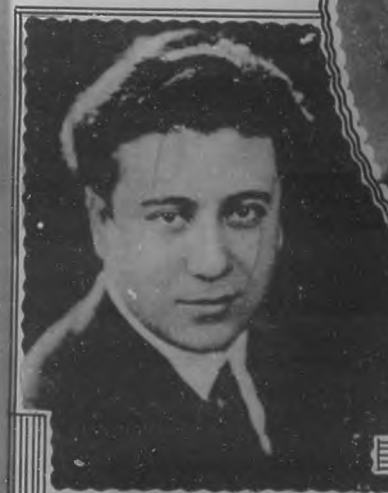
ARMAND TOKATYAN TENOR ARMENIO