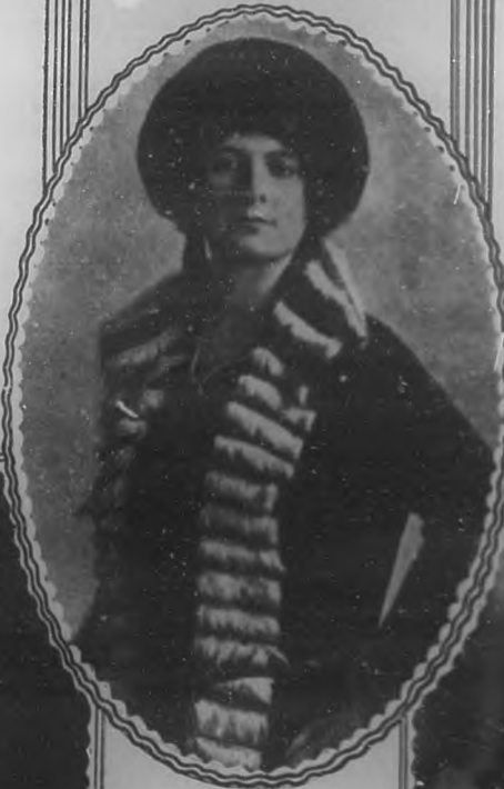
RAYMONDE DELAUNOIS EMINENTE MEZZO SOPRANO