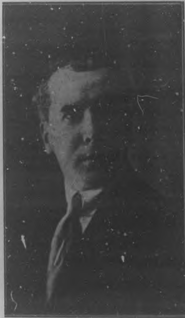
EDUARDO ZAMACOIS El ilustre novelista español, autor de "Años de miseria y de risa".