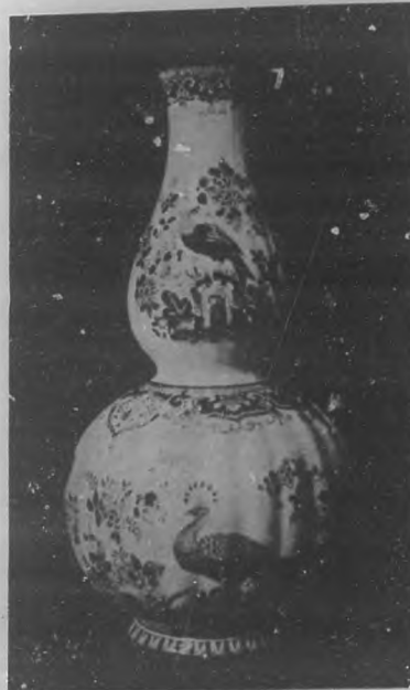
TERCER PREMIO Jarra persa de porcelana.

de las páginas de BOHEMIA, cuyos ejemplares pueden adquirirse no sólo en nuestra redacción sino en todos los principales