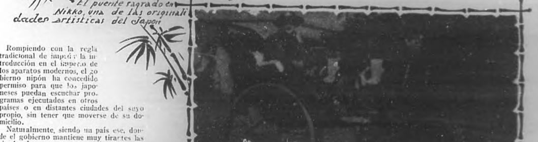
El puente sagrado en Nikko, una de las originales dadas artísticas del Japon

pintorescas y sus recuerdos familiares, ocupa un lugar preferente en todos los órdenes de la vida. Visitar uno de ellos, significa regresar al hogar con multitud de amuletos y baratijas de todas clases, ofrecidas generosamente por los habitantes, que las conservaban como reliquias de los antepasados; y es, también, guardar en el fondo del alma, para siempre, infindad de emocionantes recuerdos, de escenas entrevistas antes en grabados antiguos y representadas en ellos al natural con su misma sencillez y viveza de colorido. Esto es lo que se desprende, de la lectura de los autores que visitaron las naciones de Oriente, con el corazón dispuesto a recibir sensaciones íntimas. Examinados desde ese punto de vista, los japoneses resultarán en es-