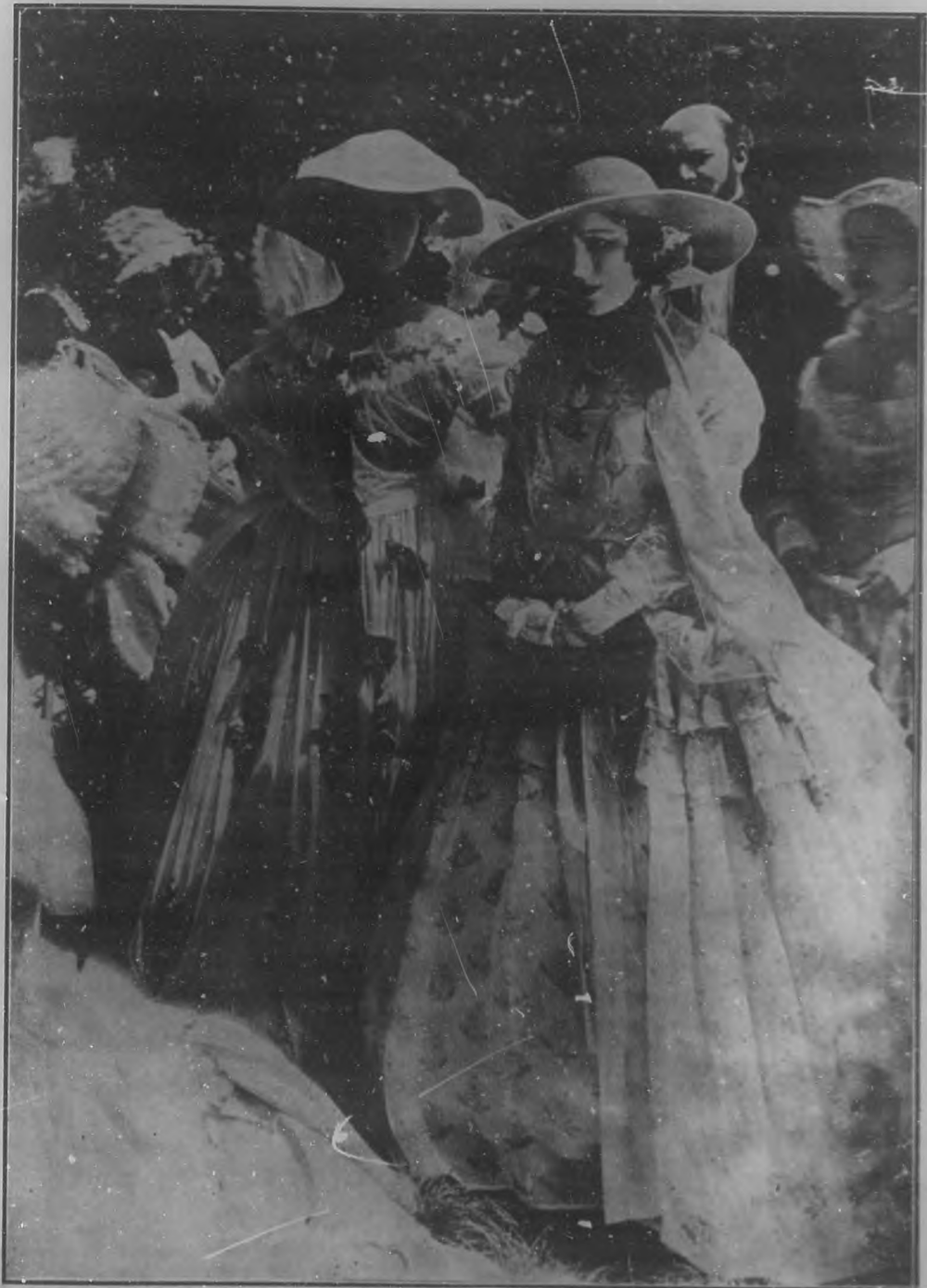
EL INGRESO DE RAQUEL MELLER EN LA CINEMATOGRAFIA.—Una de las más interesantes escenas de la película "Violetas imperiales", en la que destaca por su arte incomparable y su belleza cautivadora Raquel Meller, la genial artista española que acaba de abandonar el género de "variedades" para hacer su ingreso triunfal en la constelación de estrellas cinematográficas.

Redacción, Administración y Talleres: Edificio de BOHEMIA, América Azules (antes Tío de Oro) Teléfonos: Dirección, M-1321; Administración, A-258.