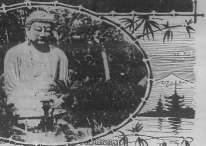
El gran Buda de Kamakura.

En los países orientales, por el contrario, el pasado con sus costumbres